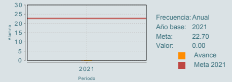
Porcentaje de estudiantes con discapacidad matriculados en los planteles federales de Educación Media Superior en el año t.